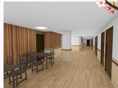
談話スペース (イメージ図)