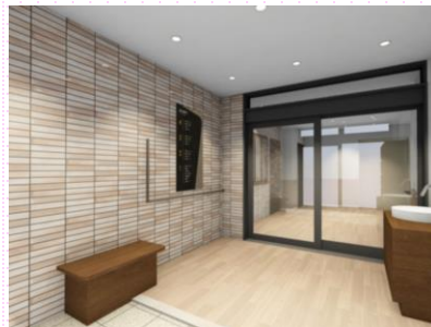
風除室 (イメージ図)