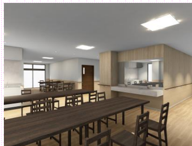
共同ホール (イメージ図)