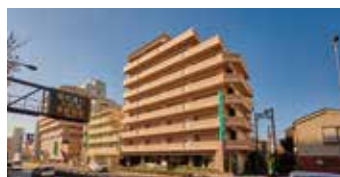
医療法人社団 苑田会 苑田第二病院

〒121-0813 東京都足立区竹の塚4-1-12 03-3850-5721(代)