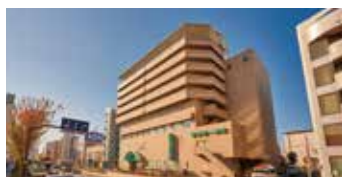
医療法人社団 苑田会 苑田第一病院

〒121-0813 東京都足立区竹の塚4-1-12 03-3850-5721(代)