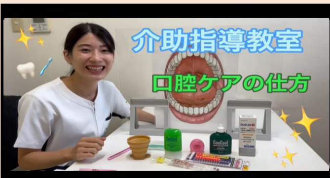
「口腔ケアのやり方」