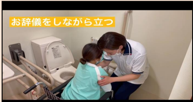
「トイレ動作の介助」