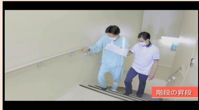
「段差や階段の介助」