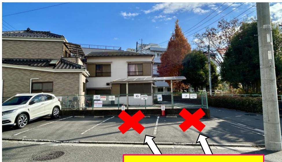
竹の塚脳神経リハビリテーション病院

R7年1月より一部駐車場の利用ができなくなります。 他契約者様のご迷惑となりますので、お停め間違いに 十分ご注意ください。